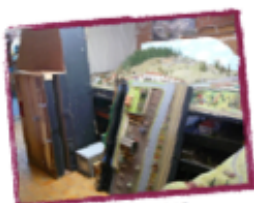
Lompret 2010 18 photos